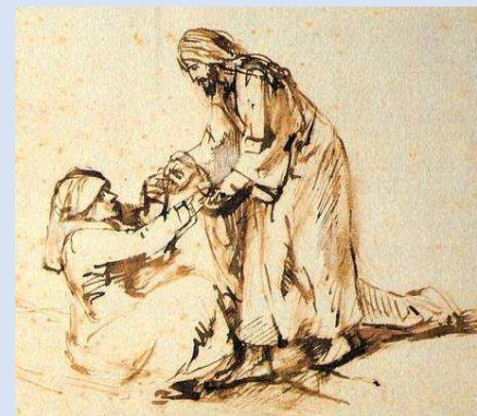
Un sacrement de guérison - p. 5