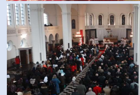
La communauté chaldéenne - p. 6