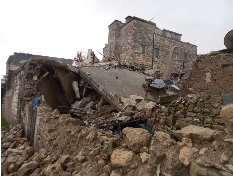
Dégâts dans l'église de Yacoubieh, au nord de la Syrie

exponentielle une situation déjà critique en raison de l'isolement de la région et du fait qu'elle est sous le contrôle des djihadistes.