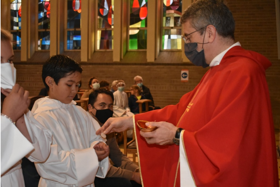
Sacrement de l'eucharistie