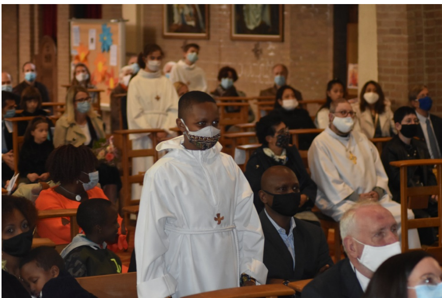
Beau moment fort : chaque confirmand est appelé par son nom et répond à l'appel du Christ: « Me voici ! »