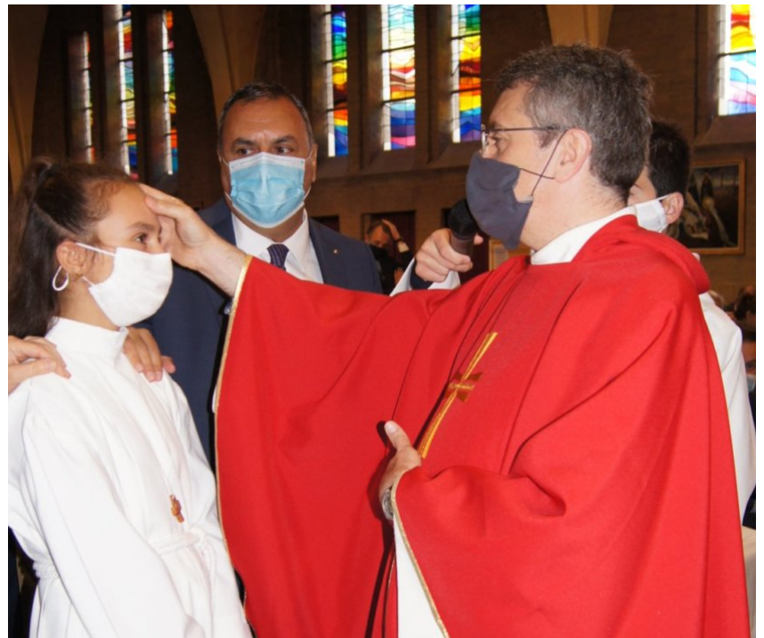
Onction avec l'huile parfumée Du saint-chrême